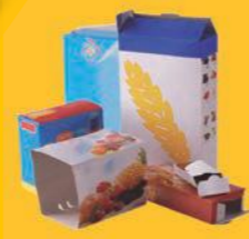
emballages en carton