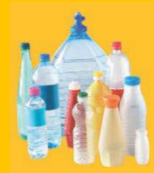
emballages en plastique alimentaire

Interdit aux déchets tels que : pot de yaourt, pot de crème fraîche, barquette en plastique, barquette en polystyrène, sac en plastique plein et fermé, couche-culotte, boîte de conserve contenant des restes, petit jouet en plastique, ordures ménagères (à mettre dans le bac vert), gros cartons (à déposer dans les déchetteries), verre, emballages en bois, pot de fleurs en plastique.