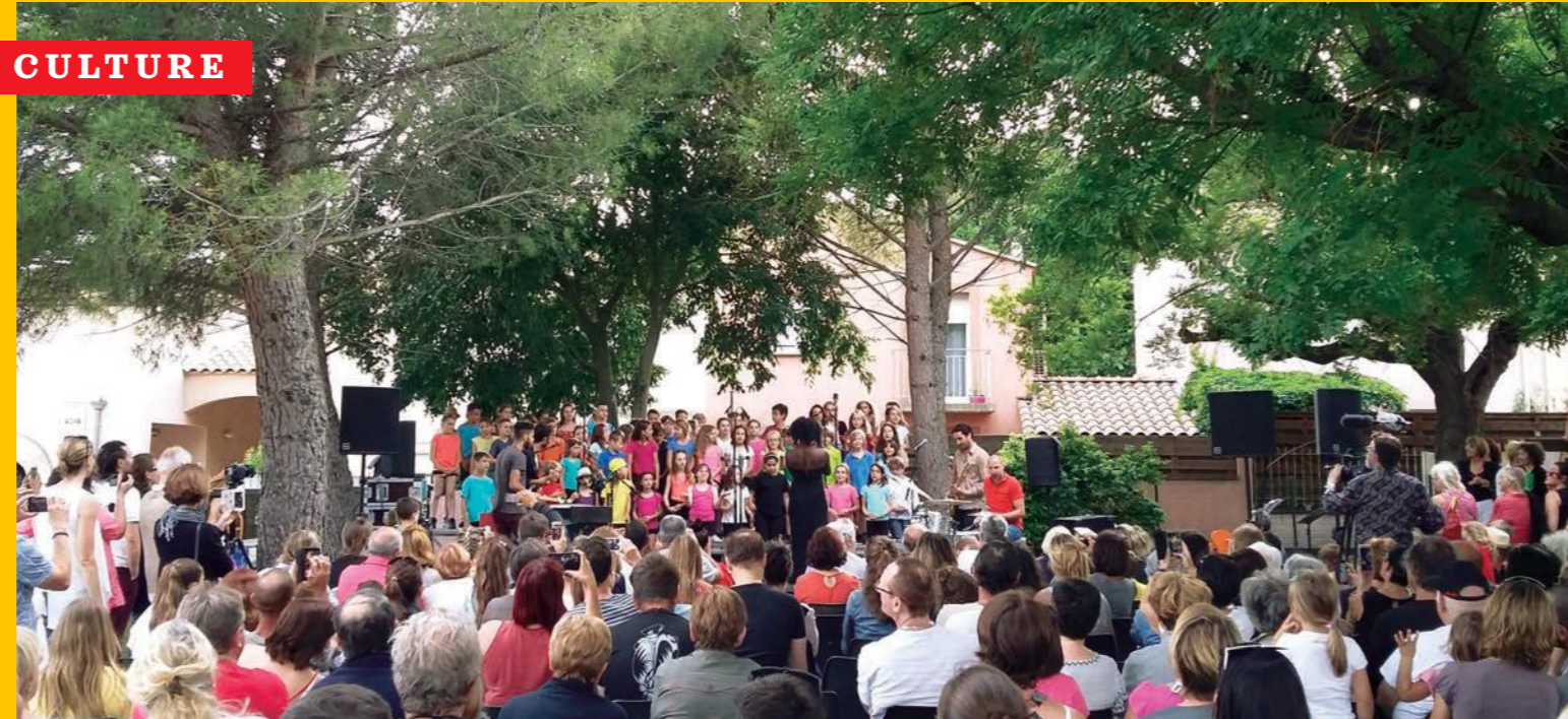
Les élèves chanteurs de Jazz à Junas