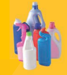
emballages en plastiques entretien