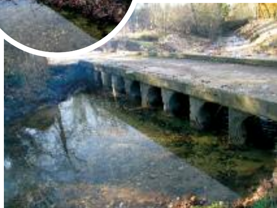
Désembâclement Pont de Pondres à Villevieille et Fontanès