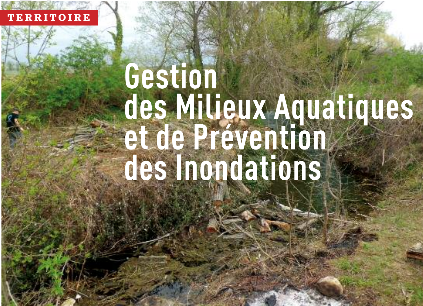
Travaux de débroussaillage et abattage à Souvignargues